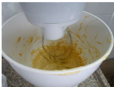
Figura 3 - Produção de espuma da polpa de umbu.

seguintes concentrações (2,5%, 5% e 7,5% (m/m)). Foram adicionados à polpa de umbu (100 gramas) e essa mistura foi submetida à agitação, em uma batedeira doméstica, por (5, 10, 15, 20, 25, e 30 minutos), podendo ser observado na Figura 3.