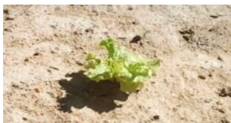
Figura 1. Cultura da alface.

O projeto foi desenvolvido no IF Sertão-PE, Campus Salgueiro numa área destinada ao cultivo de olerícolas. Para o desenvolvimento da pesquisa, utilizou-se a cultura da alface (Figura 1), a qual foi cultivada de forma orgânica. Para este estudo, foi utilizada uma área de 1,0 m 2 por unidade experimental (Figura 2). Em cada unidade experimental foram plantadas duas plantas de alface (Figura 3).