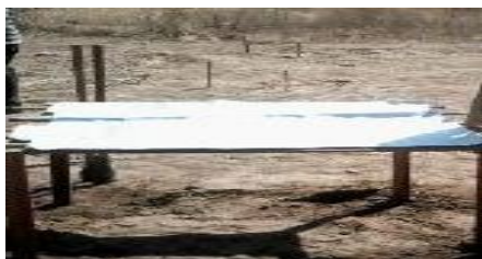
Figura 5. Dispositivo montado na área experimental.

Após a implantação do experimento, as medidas foram realizadas em um intervalo de 20 minutos, entre às 10:00 e 10:20 horas da manhã, sendo obtido um total de 10 medidas, uma a cada 2 minutos. Foram utilizadas três formas de medições de temperatura: uso de termômetro infravermelho, multímetro digital no modo termômetro e sensor de temperatura LM35 acoplado ao microcontrolador Arduino (Figura 6). Foram efetuadas medidas das temperaturas do solo no local, abaixo, acima da área sombreada e da temperatura das folhas da planta. Para cada medida, foi utilizado um equipamento diferente.