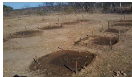
Figura 2. Área experimental.