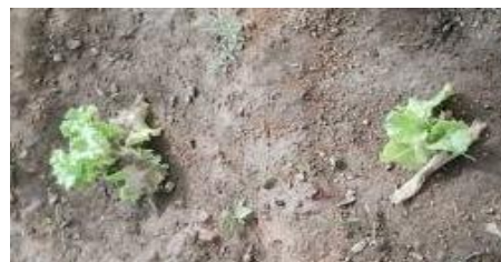
Figura 3. Plantas de alface implantadas na área experimental.

A diferença de temperatura sobre a alface foi estudada através de sombreamento obtido a partir do dispositivo confeccionado com embalagens usadas como recipientes de leite longa vida e similares, além de madeira, que recobria a área experimental (Figura 4 e 5). Tal método configura-se como inovador, considerando que em muitos estudos semelhantes, utilizam-se telas termorrefletoras e difusoras para promover a redução da temperatura. Portanto, a utilização desse dispositivo, mostrou-se promissor, necessitando de mais experimentos para ratificar a eficácia deste método como já estão sendo feitos na instituição.