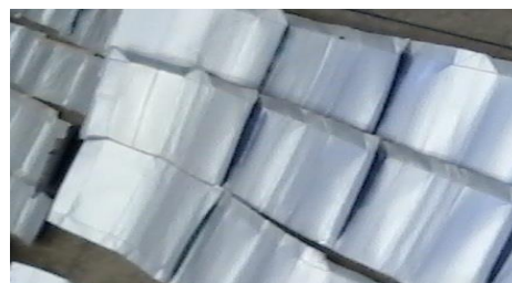
Figura 4. Embalagens longa vida utilizadas na confecção dos protótipos.

A diferença de temperatura sobre a alface foi estudada através de sombreamento obtido a partir do dispositivo confeccionado com embalagens usadas como recipientes de leite longa vida e similares, além de madeira, que recobria a área experimental (Figura 4 e 5). Tal método configura-se como inovador, considerando que em muitos estudos semelhantes, utilizam-se telas termorrefletoras e difusoras para promover a redução da temperatura. Portanto, a utilização desse dispositivo, mostrou-se promissor, necessitando de mais experimentos para ratificar a eficácia deste método como já estão sendo feitos na instituição.