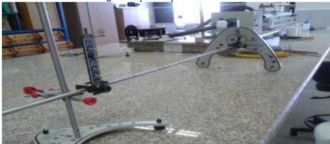
Figura 1. Aparato experimental

comércio a um baixo custo. Também vale mencionar que se pode utilizar fios de outros materiais para a realização dessa atividade.