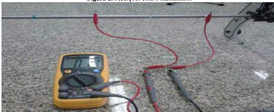
Figura 2. Medições com o multímetro.

sempre variando o comprimento (Figura 2) de dez em dez centímetros.